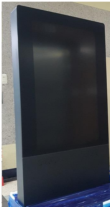
前面左右にパンチングのスピーカー穴があります。 10w × 2個となります。