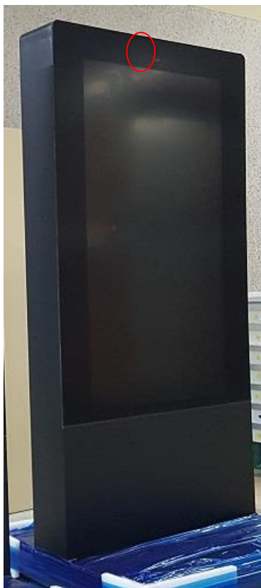
上部赤丸部にリモコン受光部があります。