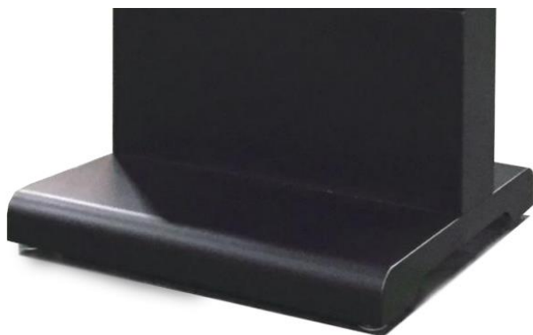
台座の仕上がりです。 台座下にはキャスター(ストッパー付)がついています。